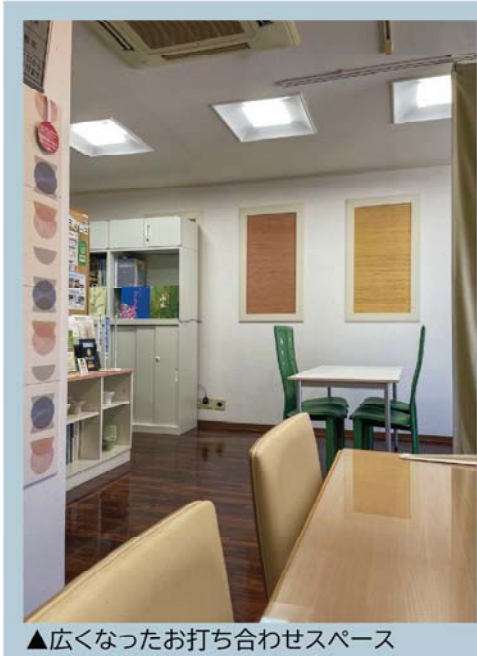
▲広くなったお打ち合わせスペース

改装後の事務所は、お打ち合わせスペースが広くなりました。 さまざまなメーカーカタログや実物サンプルを見ながらゆったりとご検討いただけます。