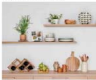
ヴィーナスノ一枚棚