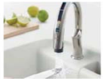
タッチレス水栓ナビッシュ ハンズフリータイプ