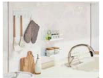
マグネット対応パネル