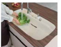
ひろびろキレイシンク