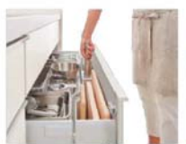
アシストポケット