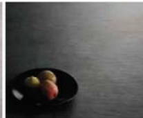
ダークコンクリート