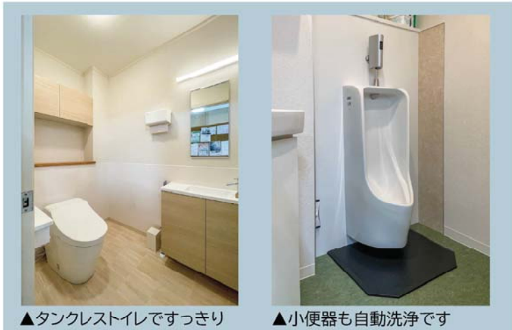
▲タンクレストイレですっきり

トイレもきれいに改装しました。便器、手洗器、収納、内装を一新し、ひろびろとした明るい空間へ生まれ変わりました。 小便器も新設しました。床面は汚れやニオイが軽減されるよう、ハイドロセラ・フロアPUS（薄型汚垂れ陶板）をひきました。