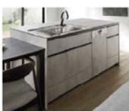
フロントオープン食器洗い機 もきれいに納まる