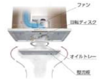
よごれんフード ファン 回転ディスク オイルトレイ 壁紙型