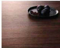
カムウォールナット