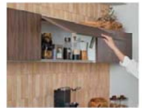
フラップ扉タイプ