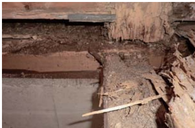
▲ シロアリ被害のある柱や土台